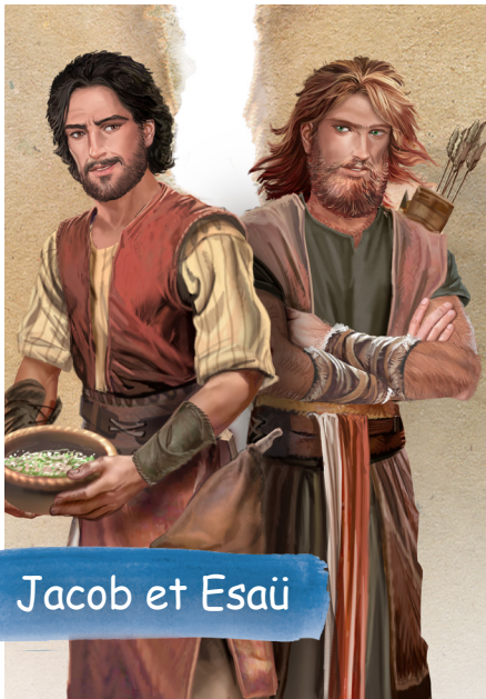
Jacob et Esau